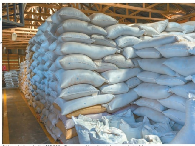
El Minagricultura destinó $25.000 millones para el incentivo al almacenamiento del arroz.

Los productores están conformes con la resolución del Ministerio de Agricultura respecto al incentivo del almacenamiento.