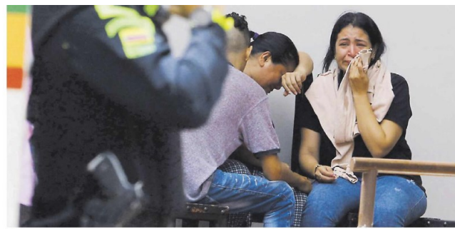
Esta semana comenzó con la salida de un grupo de personas de la Plaza de Bolívar de Bogotá, tras haber sido convocados por el ELN para una reunión.

Los 59 años de la guerra concluyeron con la expedición de órdenes del COCE y decretos del Gobierno de cara al cese de las acciones ofensivas a partir de agosto, pero la tranquilidad parece estar lejos aún.