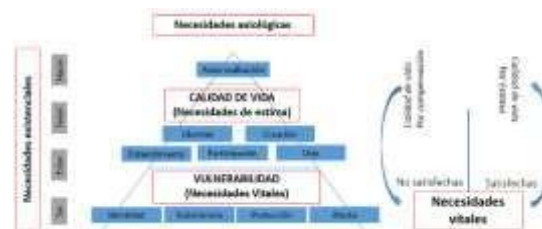
Figura 1. Integración de las teorías de necesidad

Esquema original del autor basado en las teorías de (Max-Neef, 1998), (Maslow, 1991) y aportes propios del autor.